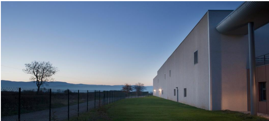
Le site des Tissages Perrin au Grand-Lemps inauguré en 2009

En 2012, le nouveau site ultra-moderne de la société, inauguré en 2009, s'est encore étendu pour accueillir de nouveaux métiers à tisser. Jacquards, unis, supports rigides, mono-extensibles, bi-extensibles : Les Tissages Perrin marquent leur différence par la multiplicité des techniques maîtrisées et leur capacité à se tenir toujours, techniques et tendances, à la pointe extrême de la modernité.