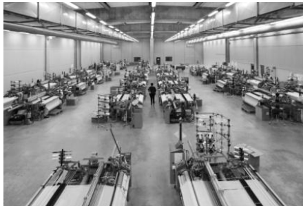
Les armures de base taffetas, sergé, satin

Le tissage : réaliser une surface textile par entrecroisement de fils de chaîne (en longueur) et de fils de trame (en largeur) suivant une séquence définie: l'armure sur métiers d'unis, le dessin sur métiers jacquards.